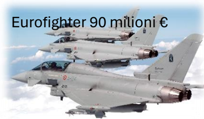
Eurofighter 90 milioni €

...tanti ospedali, asili nido e case di riposo per anziani,